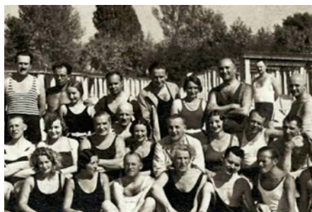
A Balatoni Íróhét résztvevői József Attilával

Sajnos a tervezett Helikonok elmaradtak. A következőre több mint tíz évet kellett várni. 1932-ben megalakult az Írók Gazdasági Egyesülete az IGE. Már alakulásának évében megrendezte a Balatoni Íróhetet. Három balatoni fürdőhelyen, Balatonfüreden, Siófokon és Keszthelyen valósult meg a nagyszabású egyhetes program. Keszthely lelkesedését emelte, hogy az Íróhét utolsó három napját a városban, illetve Hévízen töltötték az írók. Keszthely város megbízásából az IGE korábban helikoni pályázatot írt ki egy helikoni tárgyú ódára és novellára. A Helikonok szellemét tehát ismét sikerült felidézni.